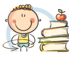
3. ФИЗКУЛЬТМИНУТКА ДЛЯ СНЯТИЯ УТОМЛЕНИЯ КОРПУСА ТЕЛА