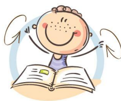
2. ФИЗКУЛЬТМИНУТКА ДЛЯ СНЯТИЯ УТОМЛЕНИЯ С ПЛЕЧЕВОГО ПОЯСА И РУК