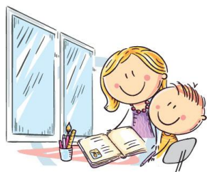
1. ЕСТЕСТВЕННОЕ ОСВЕЩЕНИЕ

РОСПОТРЕБНАДЗОР ЕДИНЫЙ КОНСУЛЬТАЦИОННЫЙ ЦЕНТР РОСПОТРЕБНАДЗОРА 8-800-555-49-43