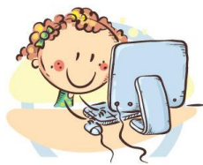
2. ПОЛОЖЕНИЕ МОНИТОРА