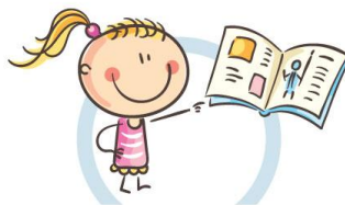
3. РАССТОЯНИЕ ДО КНИГ