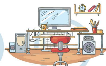
5. СООТВЕТСТВИЕ МЕБЕЛИ