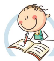
4. СИДИТЕ ПРАВИЛЬНО