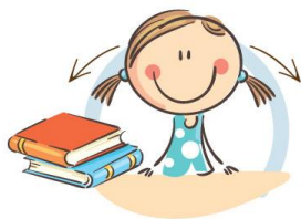
1. ФИЗКУЛЬТМИНУТКА ДЛЯ УЛУЧШЕНИЯ МОЗГОВОГО КРОВООБРАЩЕНИЯ